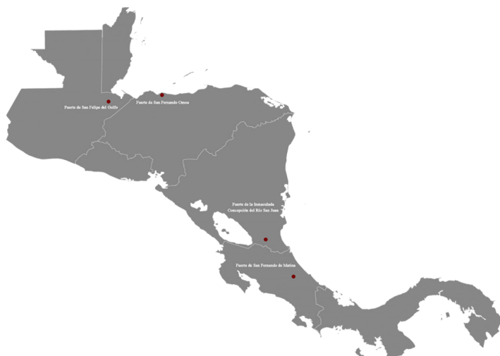
Figura 4. Localización de fuertes construidos en el siglo XVII y XVIII en la Capitanía General de Guatemala