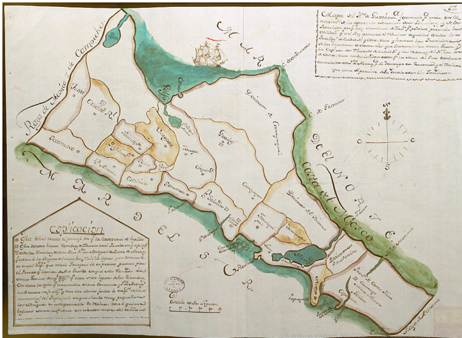
Figura 2. Mapa del Reino de Guatemala establecido por el conocimiento de la aparente situación de las poblaciones y siembras del tabaco, 1787 (Referencia ES.41091.AGI//MP, Guatemala, 309BIS)