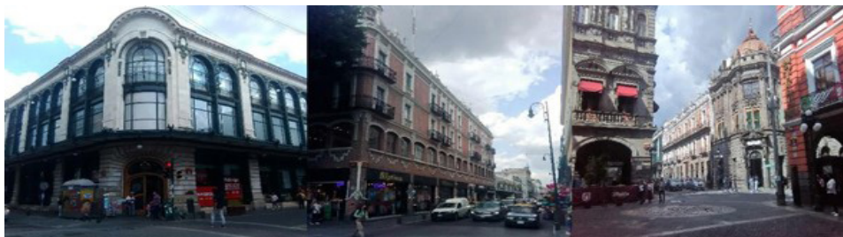
Figura 1. “Edificio de la ciudad de México, antigua calle Independencia y Mercaderes”.

dirigía al norte desde la plaza, por ejemplo, El Nuevo Siglo, las oficinas del Express Interoceánico o el restaurante Girfle que existe hasta la actualidad (Véase figura 1).