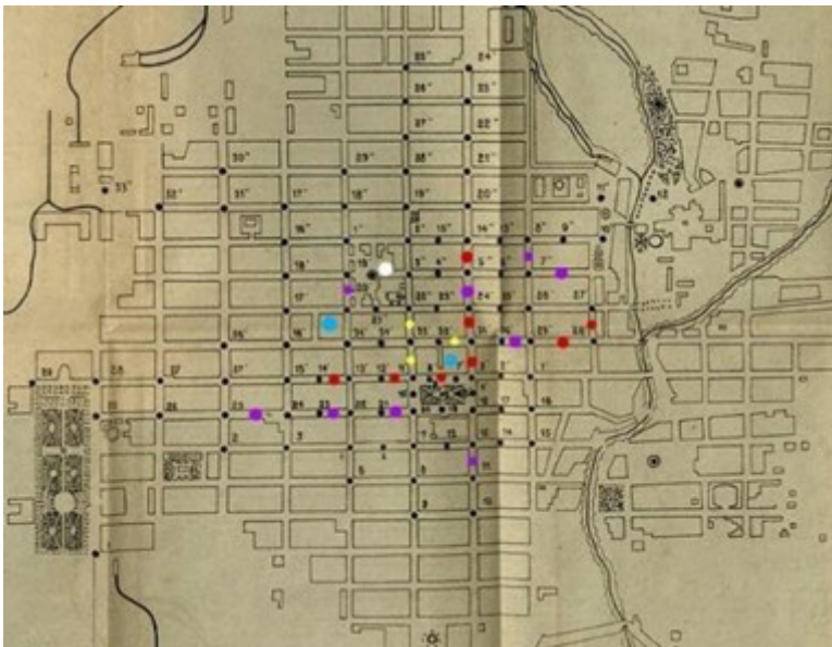
Figura 2. “Plano de la extensión del alumbrado público y la ubicación de la iluminación comercial”.