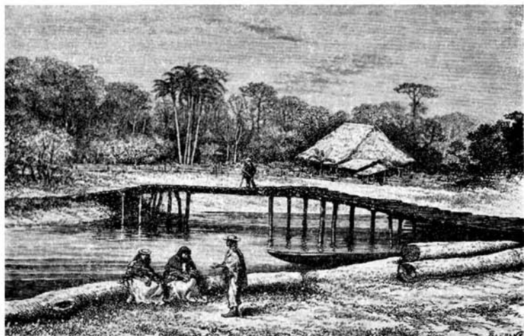
Fig. 2. Paisaje cerca de Cali, Valle del Cauca, Colombia, con una grey de pijibay al fondo. Dibujo de Riou, según croquis y fotografía de Eduardo André, 1879.