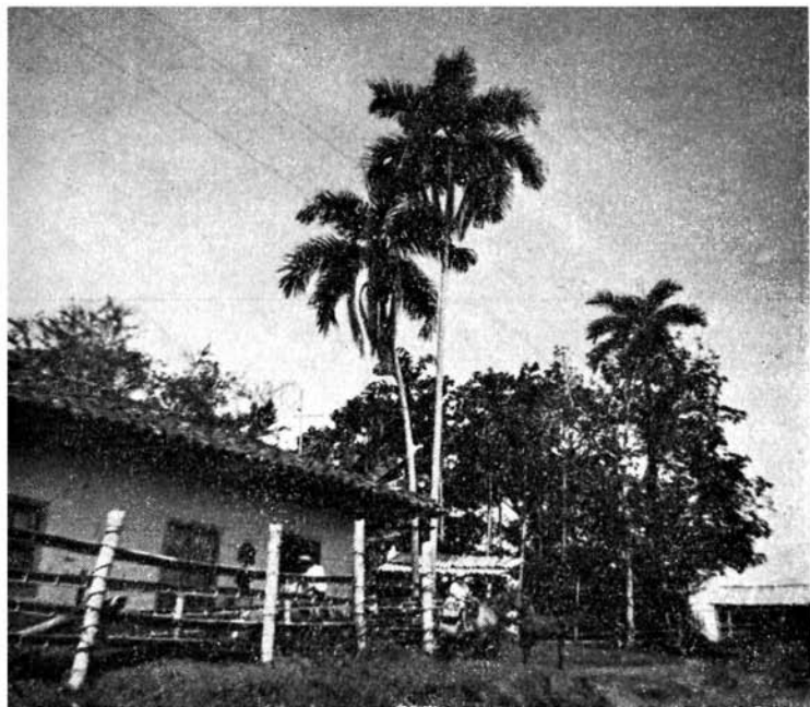
Fig. 1. Palmas de pijibay o chontaduro ( Guilielma gasipaes [HBK] Bailey). Carretera Cartago-Alcalá, Valle del Cauca, Colombia..