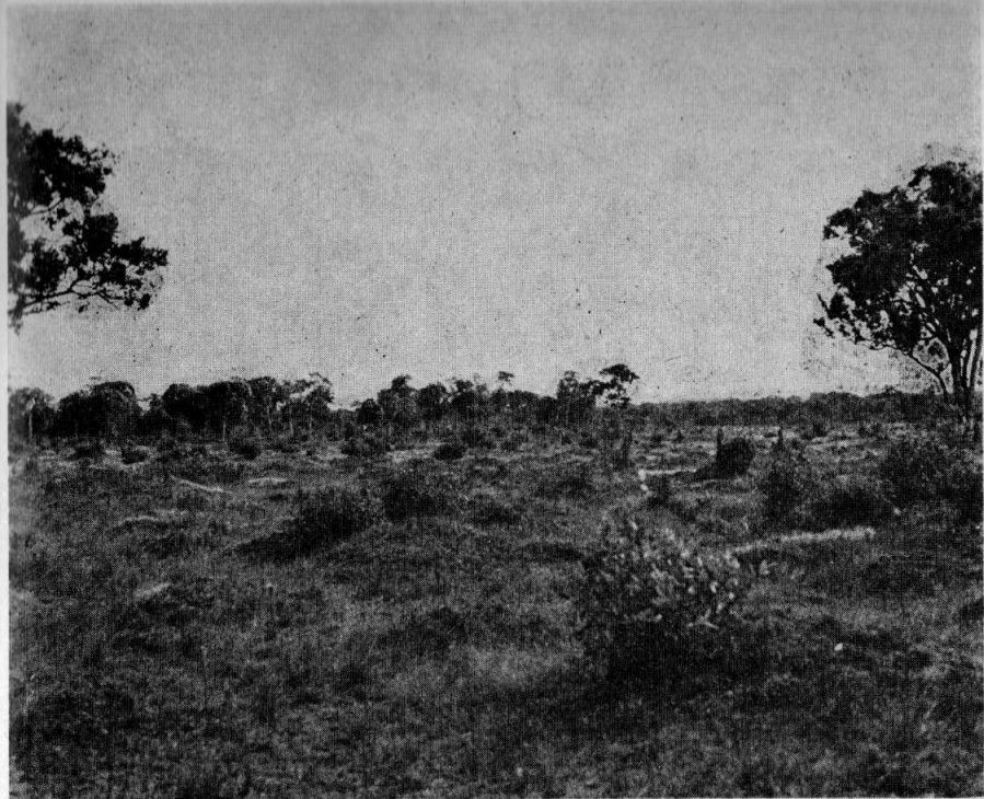
Fig. 3 Campo cubierto de montículos; Caño Cumaral