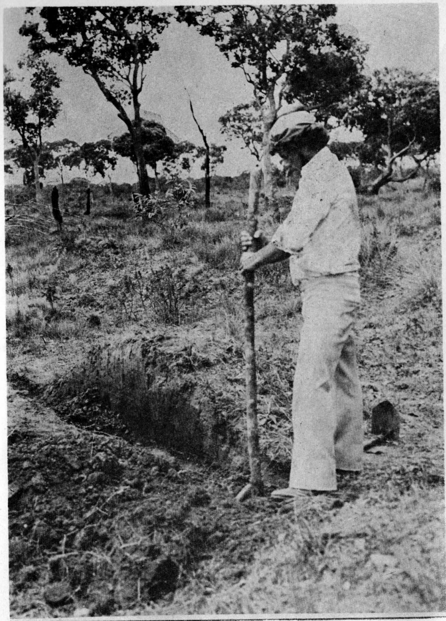
Fig. 5 Excavación de un montículo; Caño Cumaral