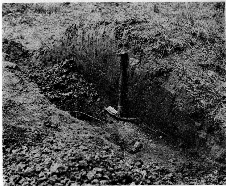
Fig. 4 Corte transversal de un montículo; Caño Cumaral