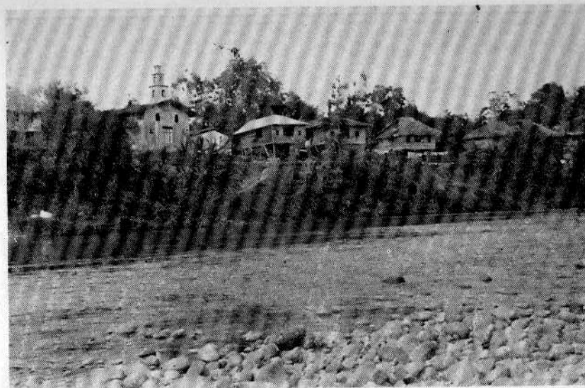
El caserío "Los Brazos" sobre el río Güelmambi, Barbacoas (Nariño).