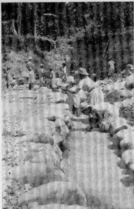
Mina de invierno "Naguare". La fuerza física se reúne socialmente para explotar el oro.