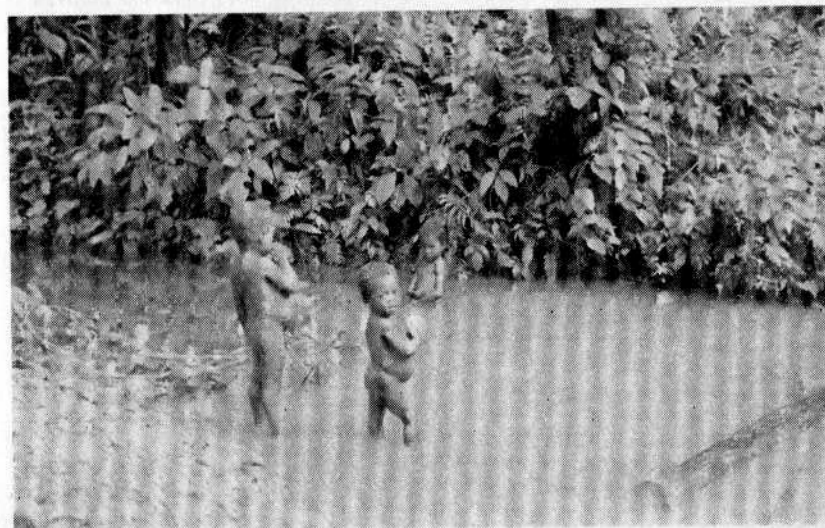
En el río Güelmambi.

Las condiciones de salud son precarias, los cabellos rojizos de los niños indican desnutrición, sus estómagos voluminosos acusan parasitismo.