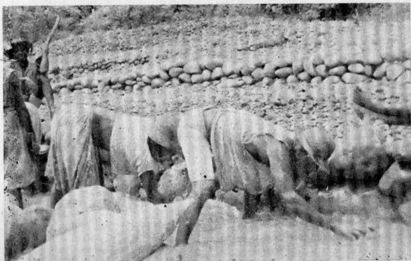
El trabajo de "jalar" en el canalón corresponde en la mina

Vestido usado por las madres y mujeres viejas mientras están en el caserío.