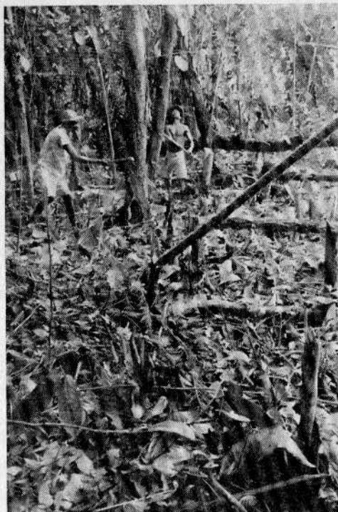
"La tumba" de árboles en el monte es labor importante para los cultivos rudimentarios de maíz.