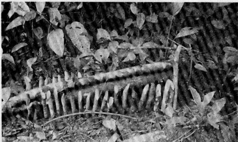
Trampa para cazar animales en el monte.