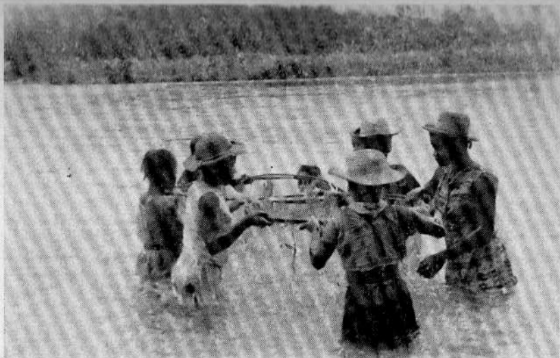
La pesca de "guañas" en el río, reúne a las mujeres jóvenes de "Los Brazos".