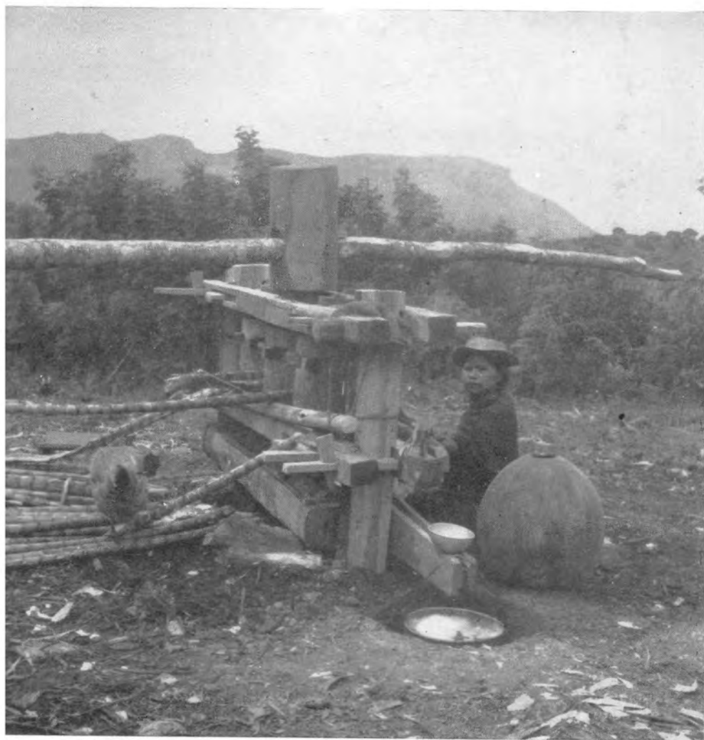
Tiegradentro IX: Trapiche de madera y la molienda (Togoima).