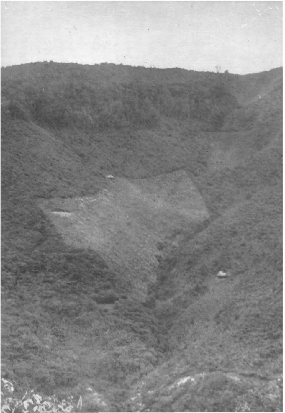
Tierradentro I: Una roza en la pendiente en El Cuartel (Vitoncó).