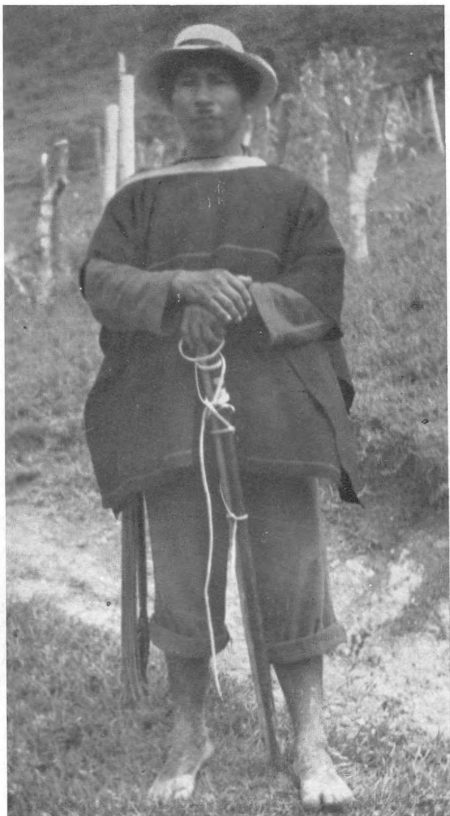
Tierradentro XIII: Gobernador de la parcialidad de San Andrés con el bastón de mando y el machete a la cintura.