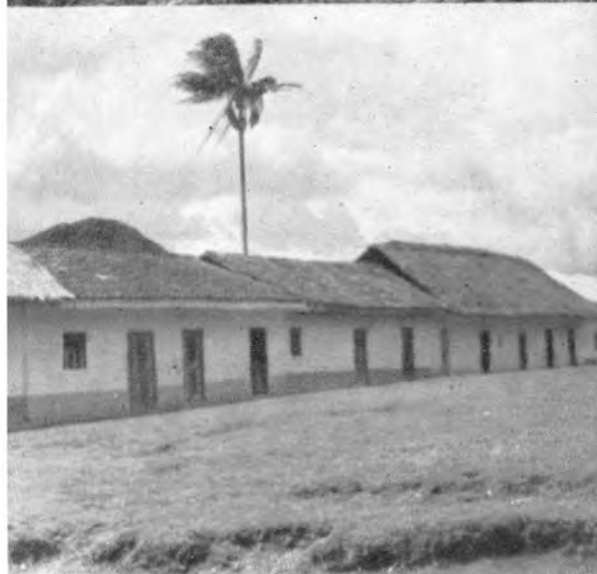
Tierradentro IV: Paisajes de Mosoco. Arriba : izquierda: Vista panorámica de Mosoco; derecha: Vista parcial del altiplano mosoqueño. Abajo : izquierda: Casas de Mosoco; derecha: Viviendas, eras y cercas de "lechero".