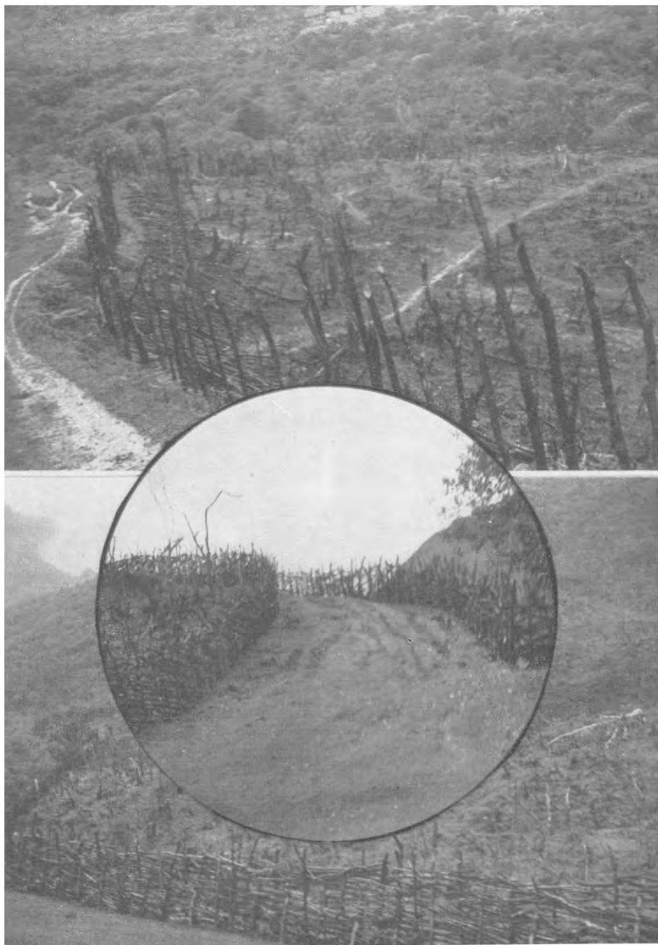
Tierradentro II: Rozas listas para la siembra mostrando las cercas concluidas y la manera típica de hacerlas (Tumbichukue y Lame).