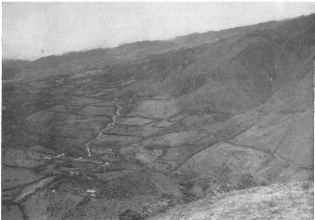
Tierradentro V: Paisaje de la vereda de Moras (Mosoco), mostrando el camino que conduce a Silvia.