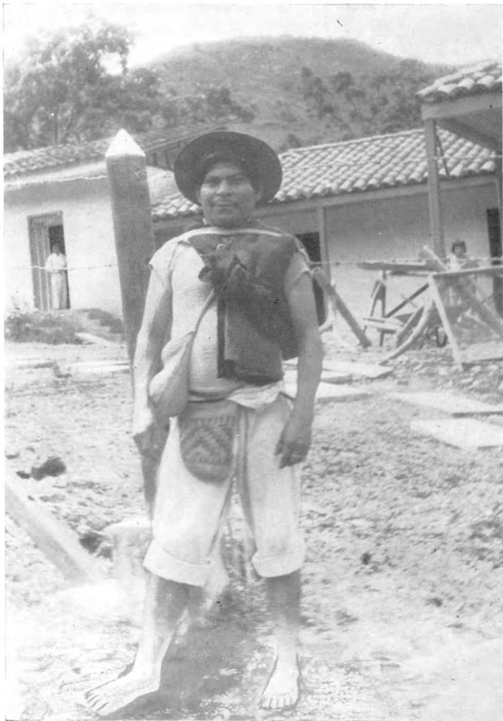
Tierradentro XI: Indio de Calderas, mostrando la forma típica de portar la kuetand yaha y las yahas (jigras de fique). Al fondo el Parque Arqueológico de Tierradentro.