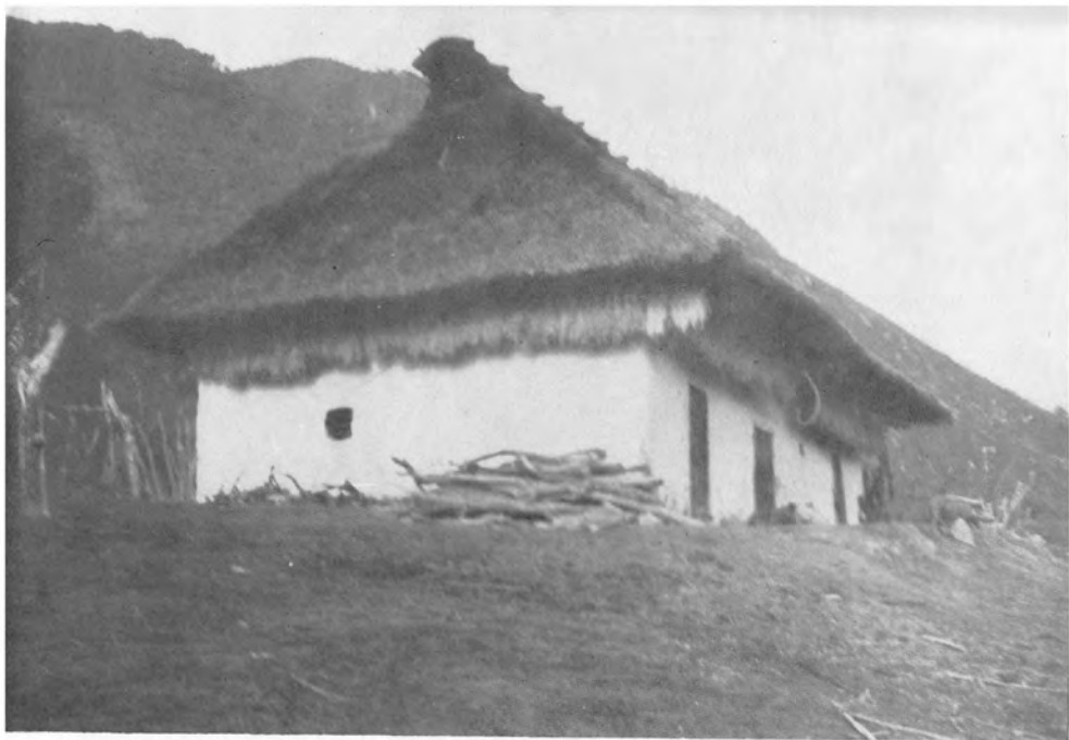
Tierradentro VIII: Vivienda de El Cuartel (Vitoncó). Obsérvese los cerdos al frente, la manera de guardar el trigo en los aleros de la vivienda y la provisión de leña.