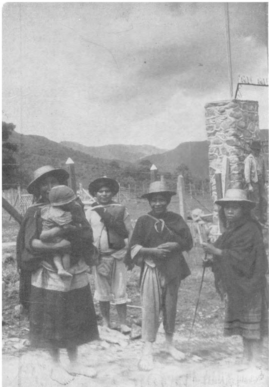
Tierradentro XII: Dos matrimonios de Calderas en el Parque Arqueológico de Tierradentro. El de la derecha es un matrimonio muy joven.