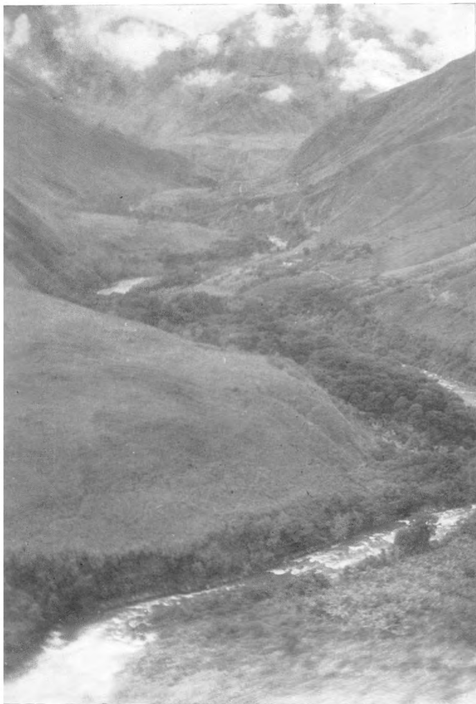
Tierradentro VII: Estrecho valle del río Páez en Juntas, mostrando las terrazas aluviales y las reducidas vegas con plantaciones de café.