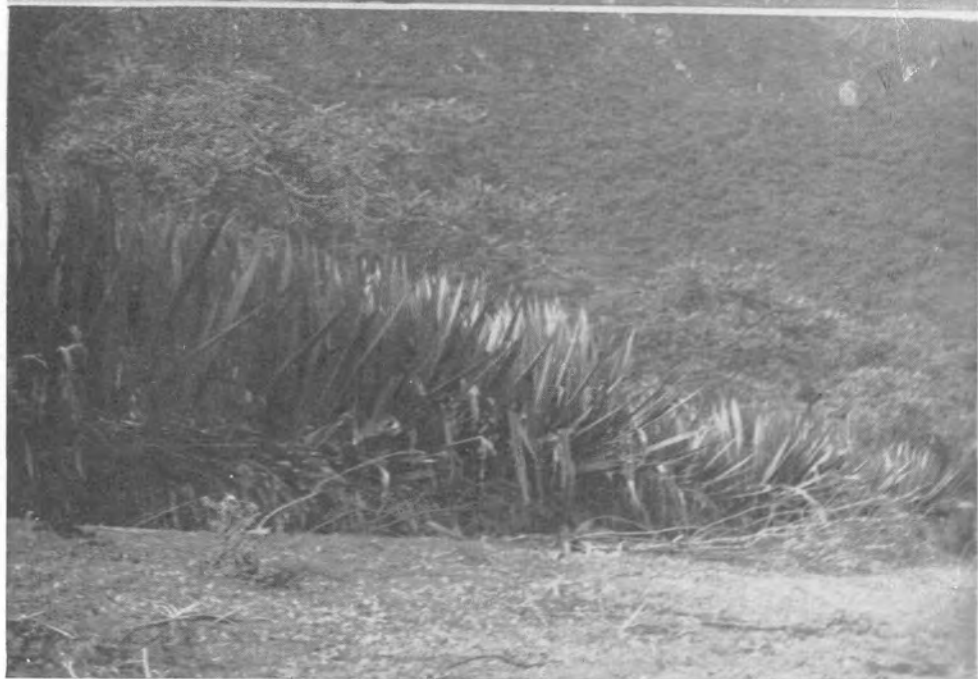
Tierradentro VI: Arriba : Vista parcial del pueblo indigena de Lame. Abajo : Plantaciones de Cabuya (Lame).