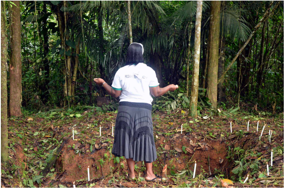
Figura 2. Oración en el hoyo en el cual los cuerpos de los muertos estuvieron hasta la exhumación realizada por la Fiscalía y Medicina Legal en el 2002