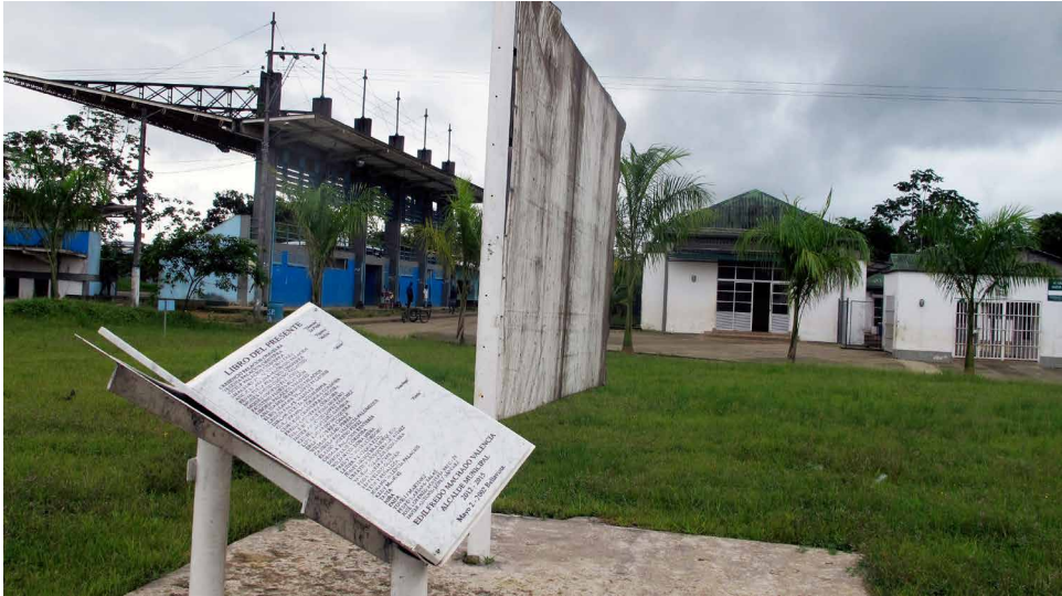
Figura 5. Libro del presente o Libro de mármol y bandera de la paz

Fuente: fotografía de Camila Orjuela Villanueva, 2 de mayo del 2013.