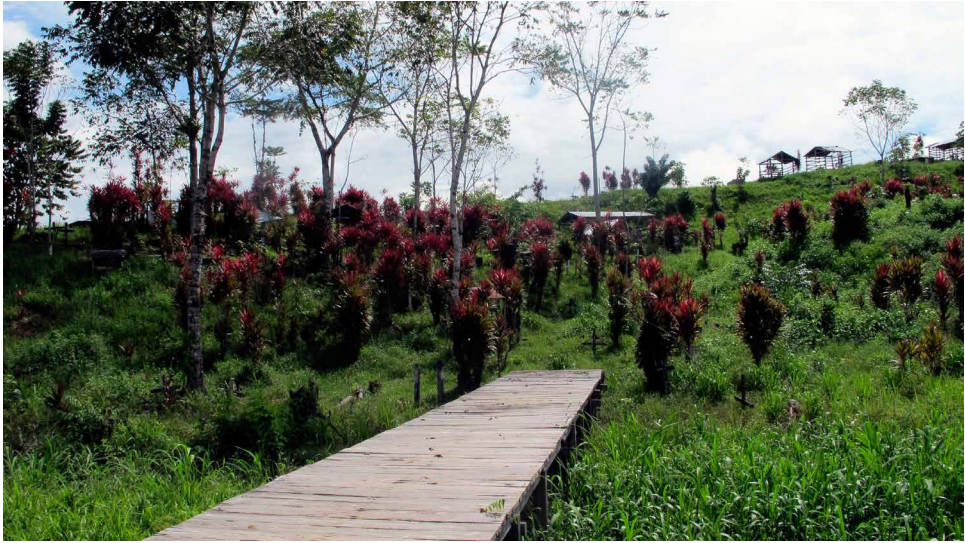
Figura 3. Cementerio de Bellavista. El Fuerte

Fuente: fotografía de Camila Orjuela Villanueva, 7 de diciembre del 2013.