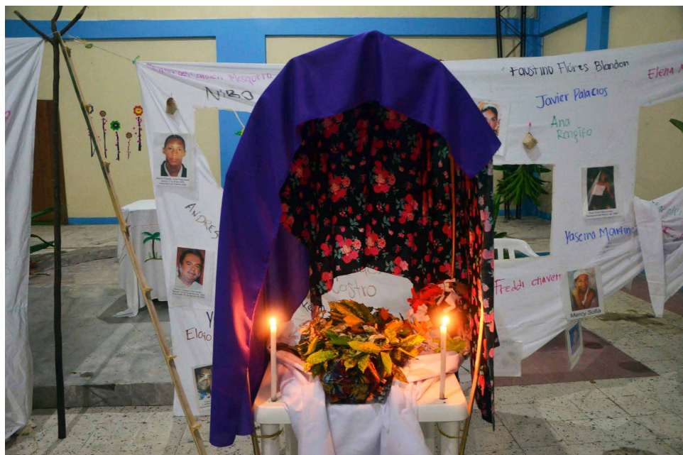
Figura 1. Tumba que hizo parte del ritual de cuerpo presente en la iglesia San Pablo Apóstol (Bellavista Viejo)